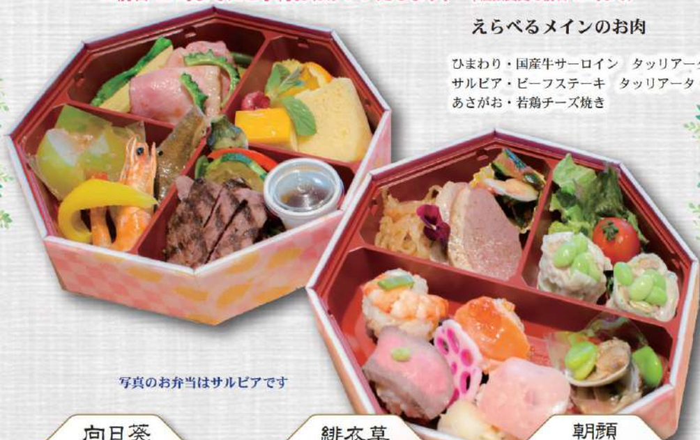
写真のお弁当はサルビアです

ひまわり・国産牛サーロイン タッリアータ サルビア・ビーフステーキ タッリアータ あさがお・若鶏チーズ焼き