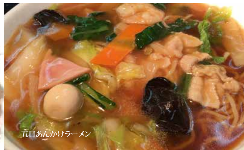
五目あんかけラーメン