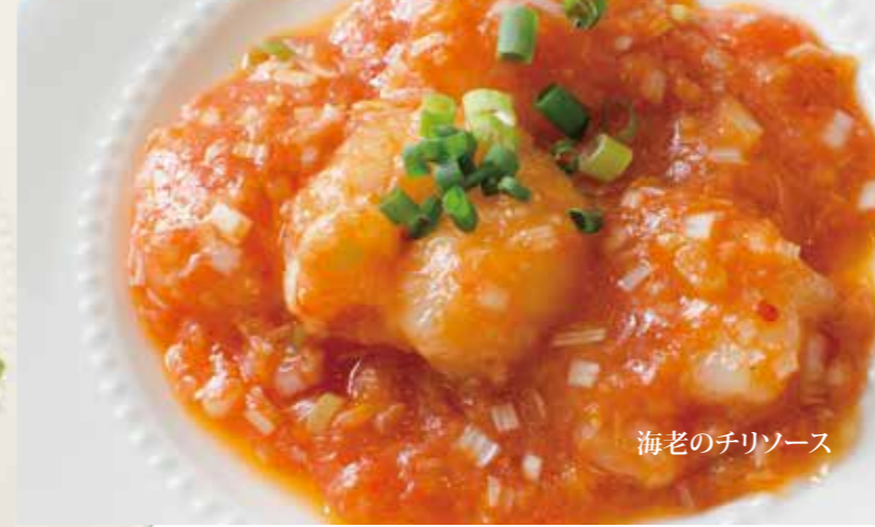
海老のチリソース