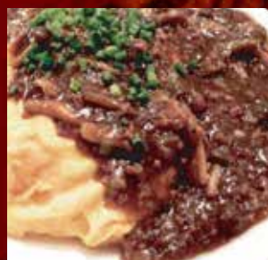
中華風オムライス