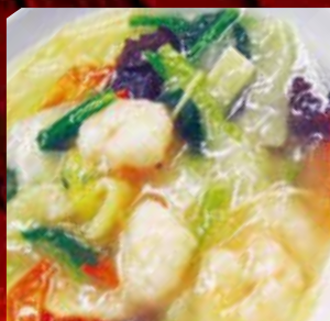
海鮮あんかけ御飯