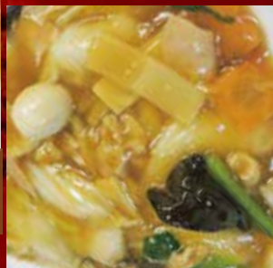
五目あんかけ御飯