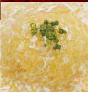
ズワイ蟹と鱈鱈入り炒飯