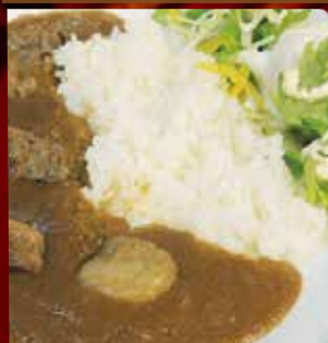
ビーフカレー (サラダ、温泉卵添え)