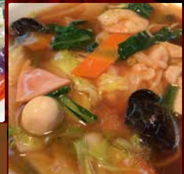
五目あんかけラーメン