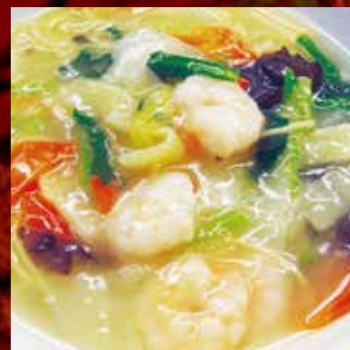
海鮮あんかけラーメン