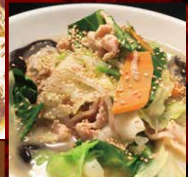
野菜たっぷりタンメン