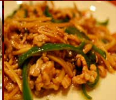
チンジャオロース