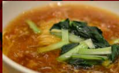
ズワイ蟹と鱈鱈入りラーメン