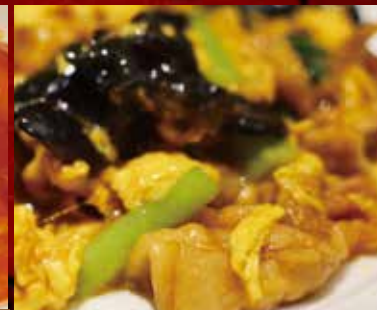
豚肉と木耳の卵炒め