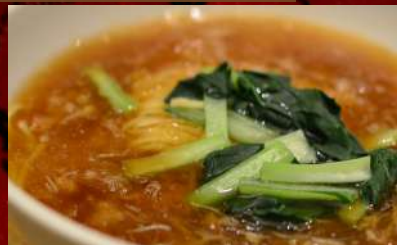
ズワイ蟹と鱻鱈 入りラーメン