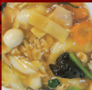
五目あんかけ 御飯