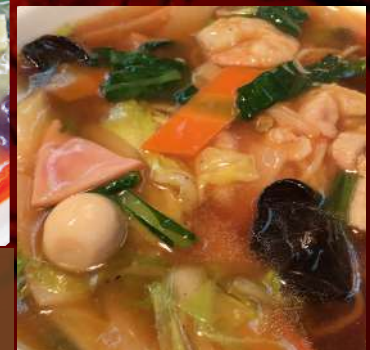
五目あんかけラーメン