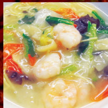
海鮮あんかけラーメン