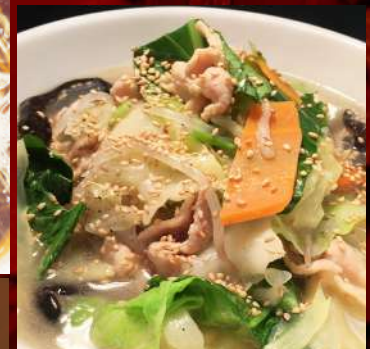
野菜たっぷりタンメン