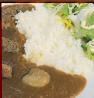
ビーフカレー (サラダ、 温泉卵添え)