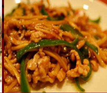
チンジャオロース