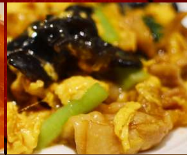
豚肉と木耳の卵炒め