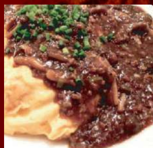
中華風オムライス