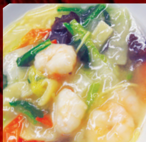
海鮮あんかけ 御飯