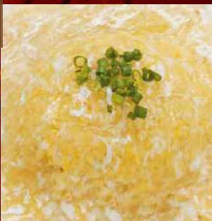
ズワイ蟹と 鱻鱈入り炒飯